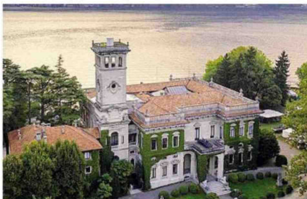
Confermata la location di Villa Erba